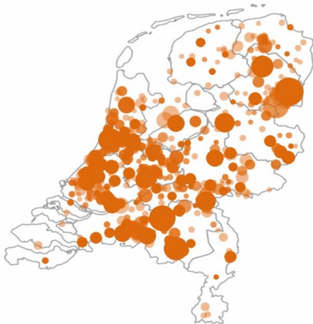
Afb.) Herkomst museumkaartbezoekers.