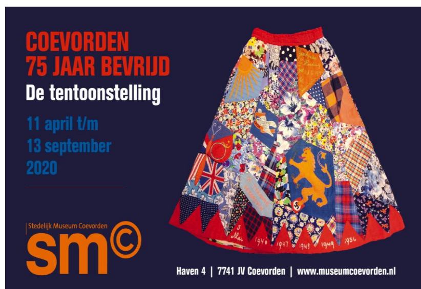
Afb.) Facebookbanner van de geannuleerde tentoonstelling: 'Coevorden 75 Bevrijd'.

Het was de bedoeling dat vanaf medio april een grote tentoonstelling gewijd zou worden aan de bevrijding van Coevorden die in 2020 vijfenzeventig jaar geleden plaatsvond. Het Stedelijk Museum Coevorden wilde behalve stukken uit de eigen collectie ook bruikleenstukken van andere musea zoals Stichting Museum Ergens in Nederland 1939-1945 en Historische Collectie Regiment Stoottroepen Prins Bernhard (Stoottroepenmuseum) exposeren. Daarnaast had het museum een oproep gedaan aan Coevordenaren om persoonlijke verhalen en objecten in te sturen die te maken hadden met de bevrijding.